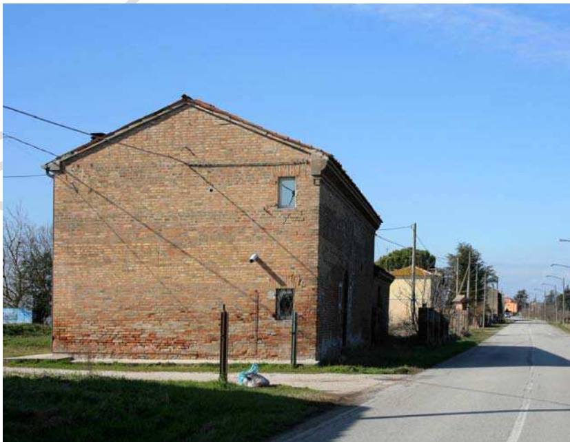
Oggetto Fabbricato ad uso ex abitazione (1): fronte est