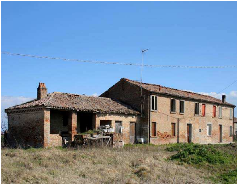
Oggetto Fabbricato ad uso ex abitazione (1): fronti ovest e sud Fabbricato ad uso ex proservizi (3): fronti ovest e sud