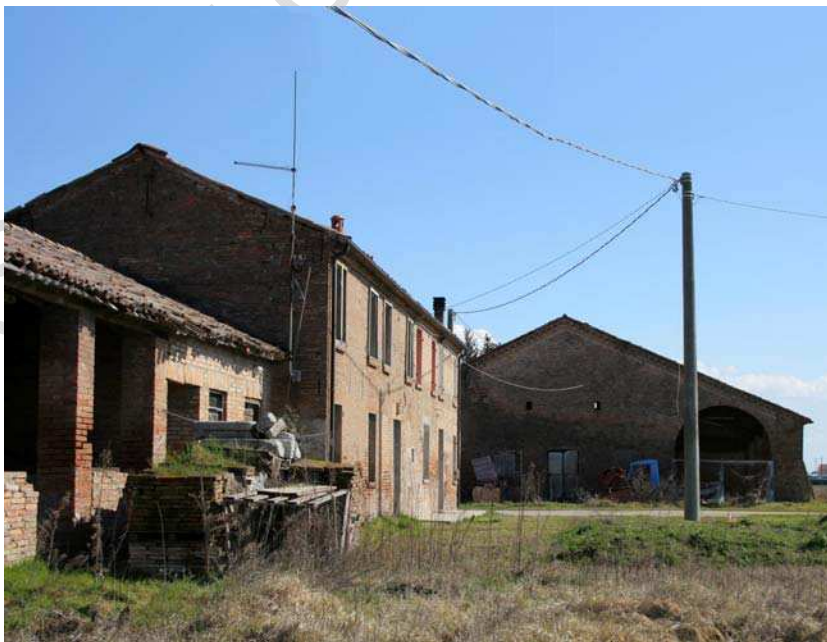
Oggetto Fabbricato ad uso ex stalla-fienile (2): fronte ovest