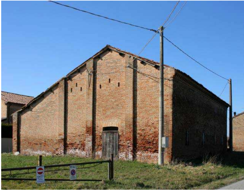
Oggetto Fabbricato ad uso ex stalla-fienile (2): fronti est e nord