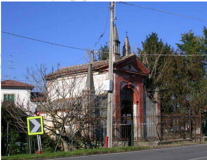
Oggetto Fabbricato ad uso specialistico (1): fronti sud ed est