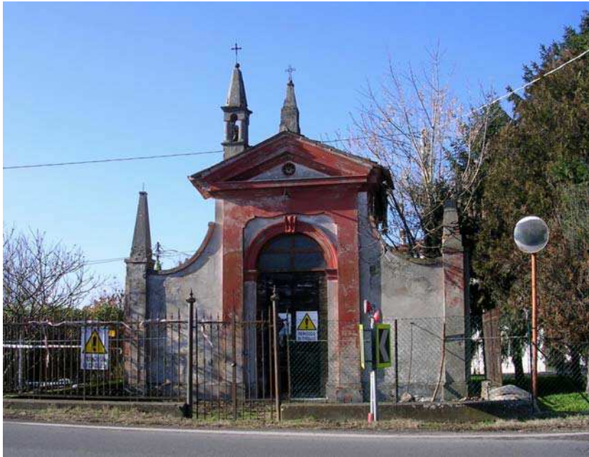
Oggetto Fabbricato ad uso specialistico (1): fronte est