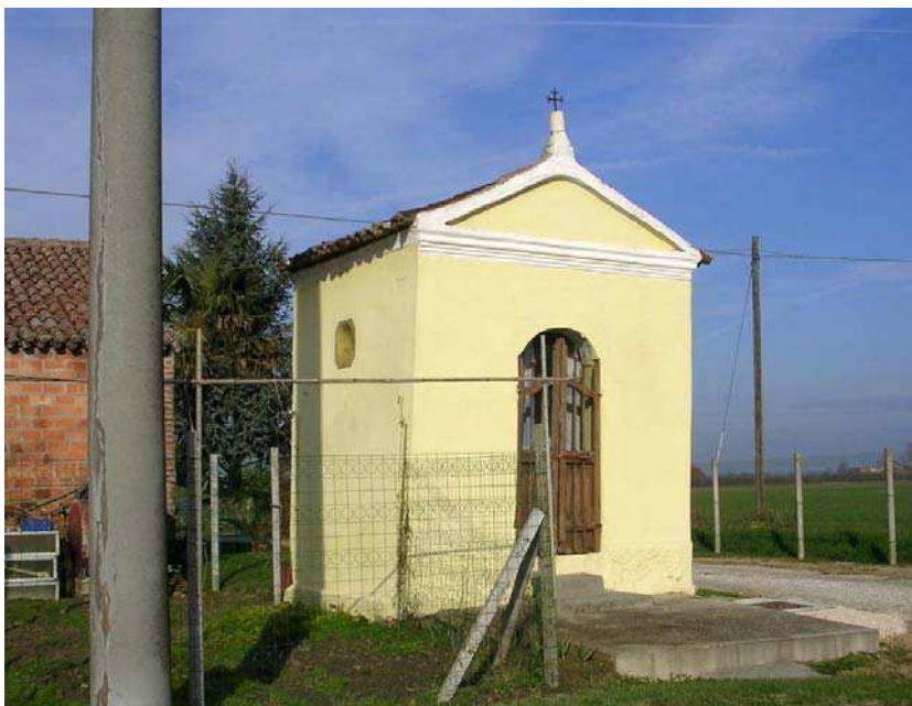
Oggetto Fabbricato ad uso specialistico (1): fronti ovest e sud