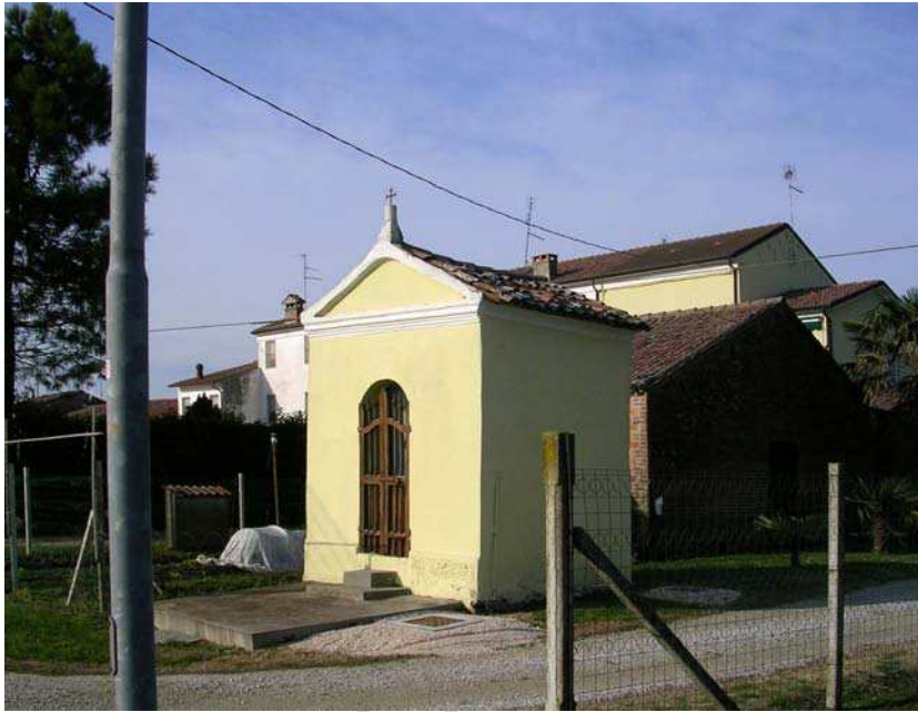
Oggetto Fabbricato ad uso specialistico (1): fronte sud ed est