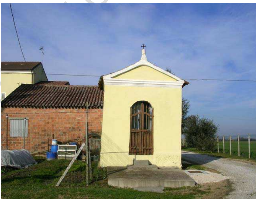
Oggetto Fabbricato ad uso specialistico (1): fronte sud